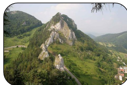
Bílé Karpaty – biosférická rezervace UNESCO