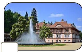
D. Rožnov pod Radhoštěm