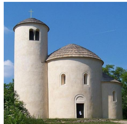
Rotunda sv. Jiří a Vojtěcha