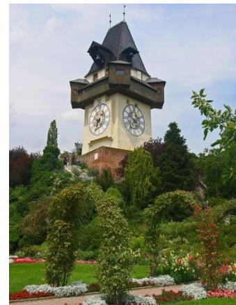
Hodinová věž - Graz