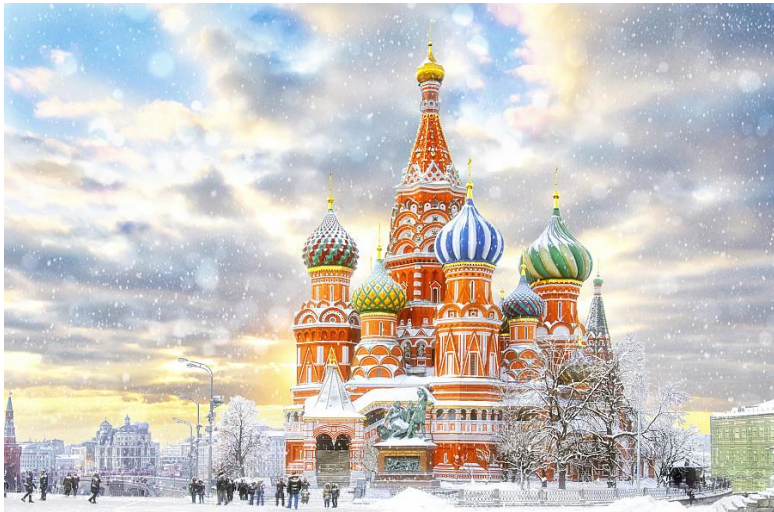
Chrám Vasila Blaženého