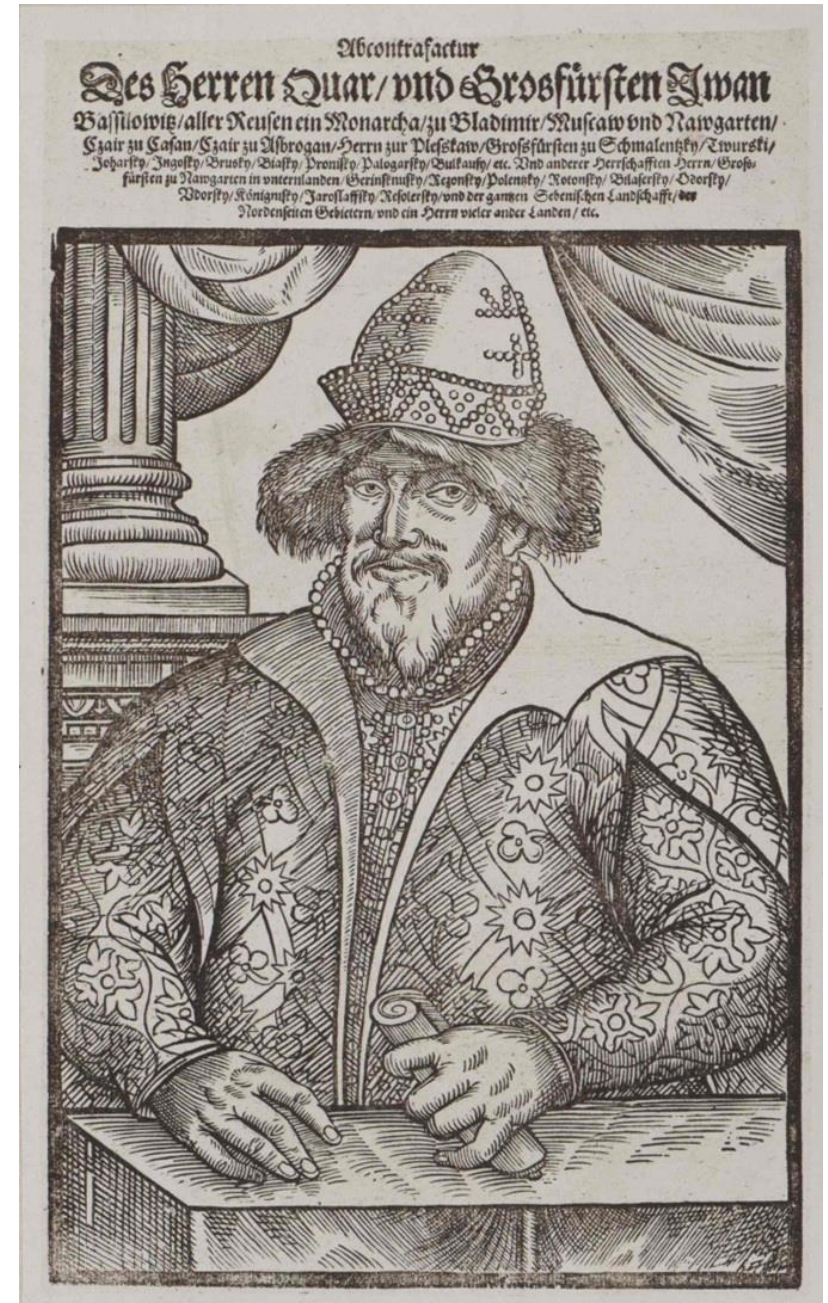
Ivan IV. Vasilevič